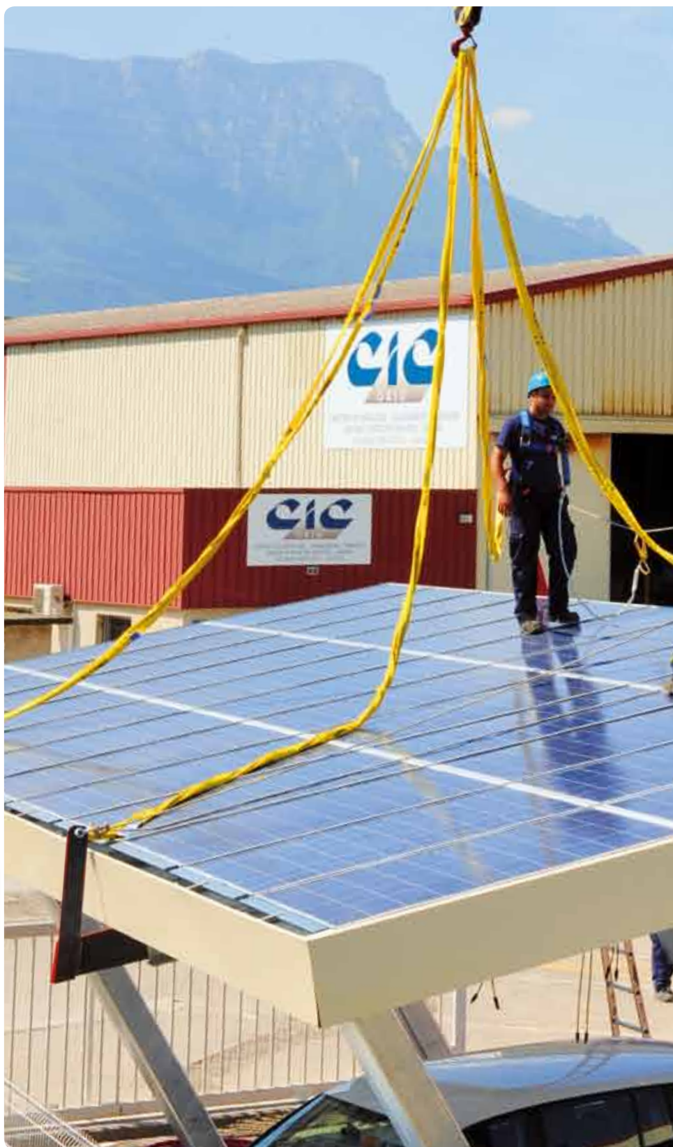
L'ombrière, nouveau système photovoltaïque développé par CIC Solaris en s'appuyant sur ses compétences métallurgiques (voir article p.10-11).

Imprimé sur Novatech, papier écologique.