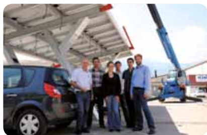
L'équipe CIC Solaris et sa première ombrière photovoltaïque.

qui du coup produisent plus d'électricité. D'autres produits propres suivent : les pare-soleils photovoltaïques orientables de fenêtre, les ombrières de parking. Ces dernières apportent une réponse aux questions énergétiques, économiques, écologiques : on produit de l'électricité, on la produit sur place, les voitures abritées consomment moins de climatisation, l'énergie produite est soit revendue à EDF, soit utilisée pour alimenter une flotte de véhicules électriques. « L'ombrière est moins rentable à ce jour que les structures de toitures, poursuit Olivier Six, mais deviendra économiquement intéressante quand les voitures électriques se généraliseront. » Ces solutions intéressent aussi bien les entreprises (Perstorp, Rhodia, Isochem, A Raymond, Udimec, etc.) que des investisseurs. L'investissement dans de telles centrales d'exploitation solaire offre une rentabilité de 6 % net, avec des revenus sans risques et éligibles à l'ISF. Pour mener à bien un tel développement, CIC Solaris a acquis des compétences en photovoltaïque et en finances. À mi 2010, elle continue à recruter et prévoit de doubler son chiffre d'affaires d'ici fin 2012. ■